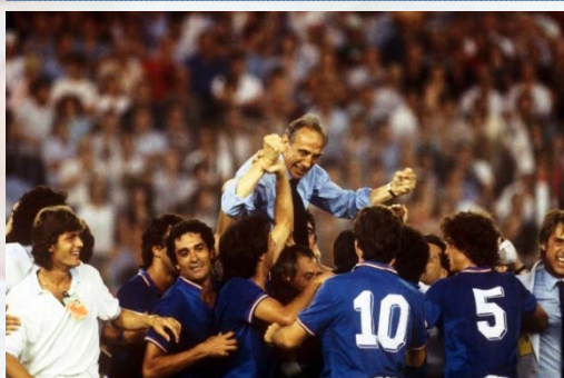
A Madrid l'Italia di Bearzot è Campione del Mondo per la terza volta (1982)