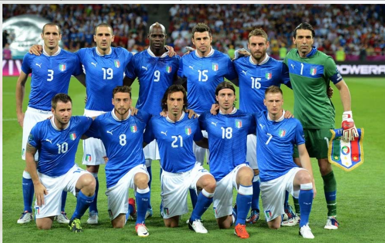
L'Italia finalista nel 2012