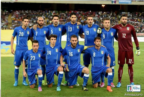
Italia – Olanda 2-0