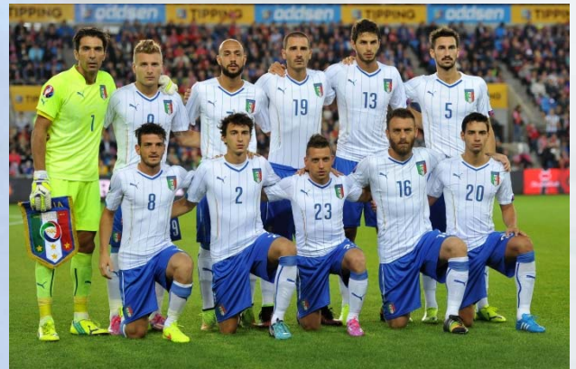
Norvegia - Italia 0-2