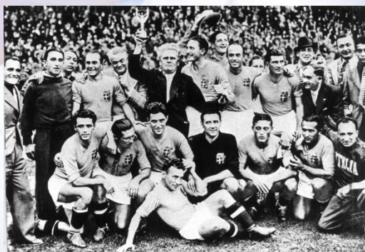
La Nazionale Campione del Mondo nel 1938