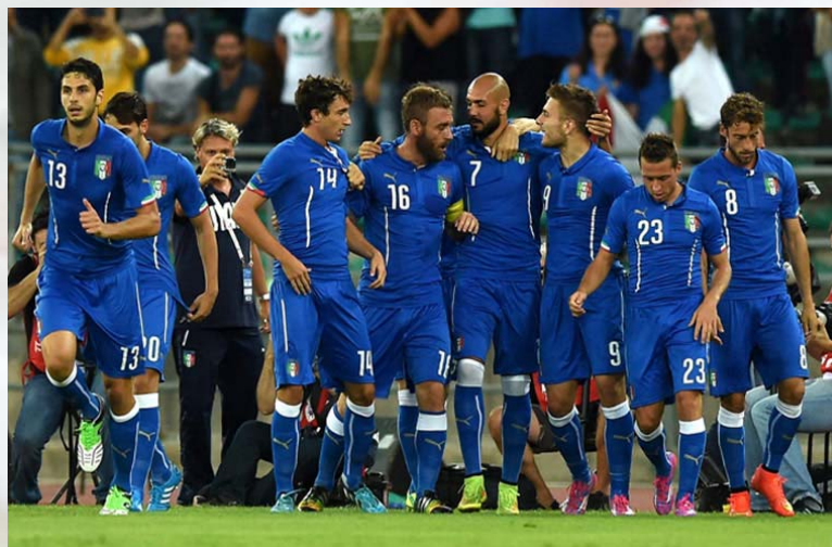
De Rossi festeggia dopo il rigore segnato all'Olanda