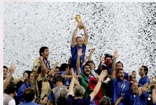
Cannavaro alza la Coppa a Berlino nel 2006. Per gli Azzurri è il quarto trionfo.