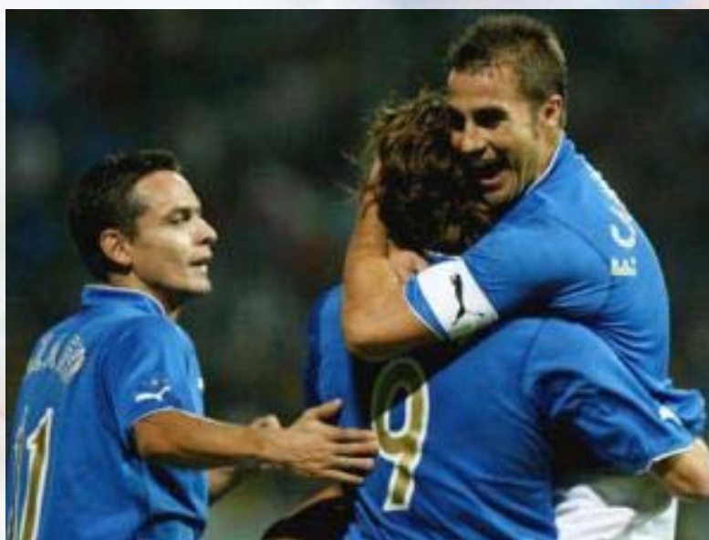
Inzaghi e Cannavaro festeggiano Vieri autore di uno dei 4 gol nella sfida del 2003 disputata a Reggio Calabria