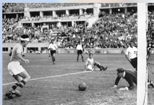
Il Gol di Frossi per l'Oro olimpico del 1936