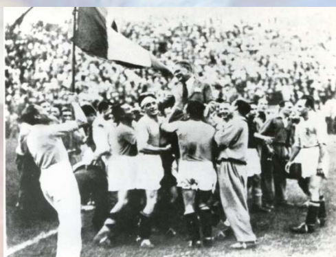
Pozzo portato in trionfo dopo la finale del 1934. Per gli Azzurri è il primo titolo