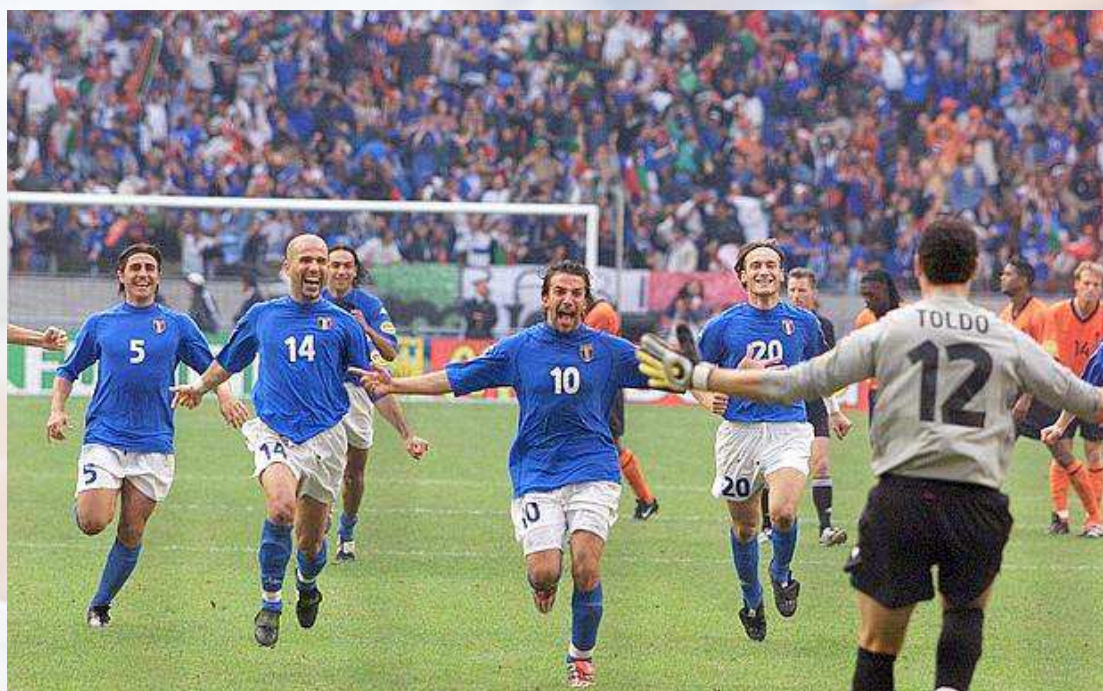
Gli Azzurri superano l'Olanda ai rigori e raggiungono la Finale di Euro 2000