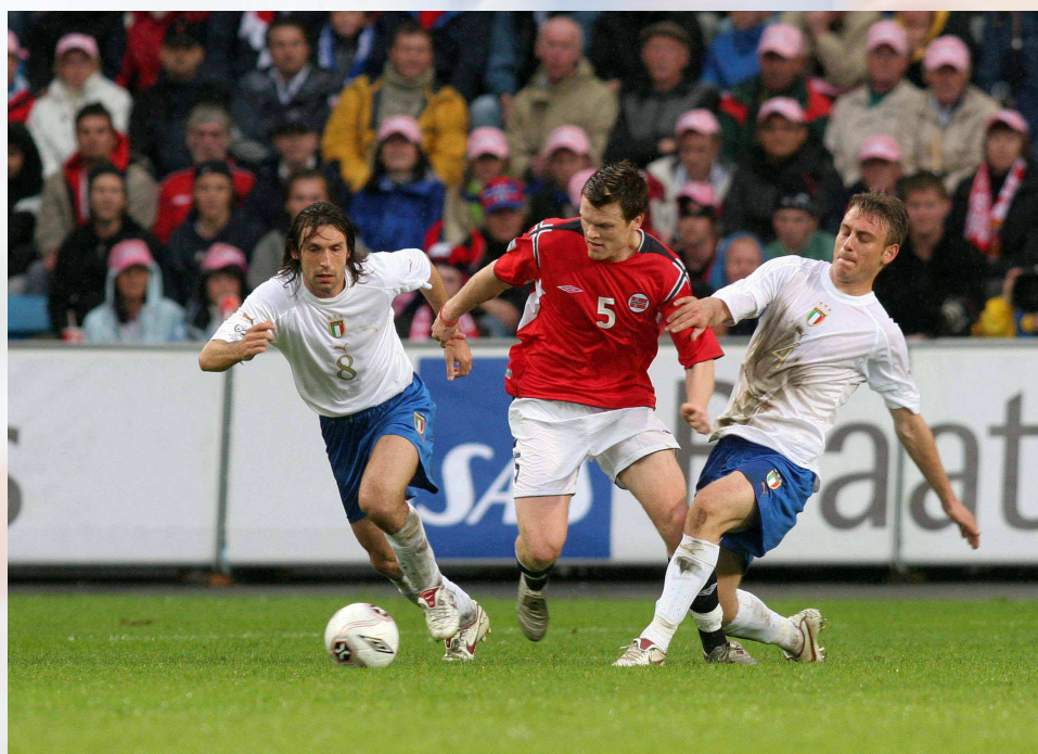
Pirlo, Riise e De Rossi in azione a Oslo nella sfida del 2005