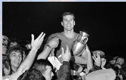
Il trionfo azzurro al Campionato europeo del 1968. Facchetti alza la Coppa