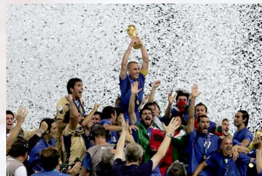
Cannavaro alza la Coppa a Berlino nel 2006. Per gli Azzurri è il quarto trionfo.