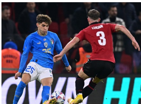
FOTO: Pafundi, all'esordio in Albania, il più giovane dal 1911.

Balotelli, Belotti, Berardi, Bernardeschi, Cancellieri, Caprari, Caputo, Chiesa, Cutrone, El Shaarawy, Giovinco, Gnonto, Grifo, Immobile, Insigne, Joao Pedro, Kean, Lasagna, Okaka, Orsolini, Pafundi, Pavoletti, Pellegrini, Pinamonti, Politano, Raspadori, Retegui, Scamacca, Quagliarella, Verdi, Zaccagni, Zaza, Zerbin.