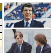
Dall'alto. I CT Friulani Dino Zoff e Cesare Maldini